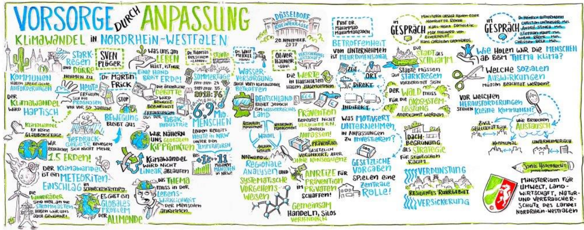
Bilddokumentation der Veranstaltung durch den Künstler Jonas Heidebrecht